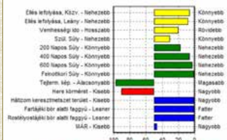
Az öszvevők százaival összehasonlítva a 2016-ban született borjak TÉ-inek fajtájágról jelenti